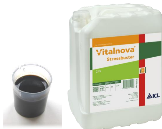
10ℓ (約 12.25kg)