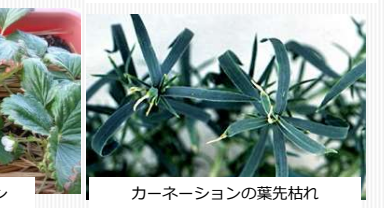
カーネーションの葉先枯れ