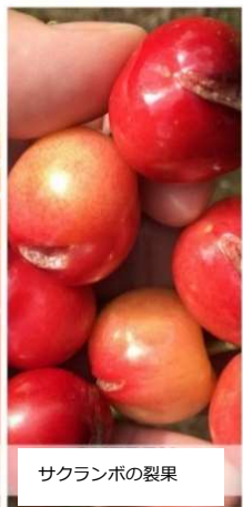
サクランボの裂果