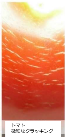
トマト 微細なクラッキング