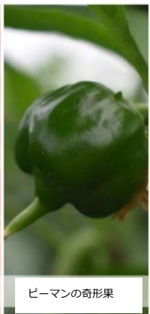
ピーマンの奇形果