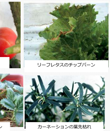
リーフレタスのチップバーン