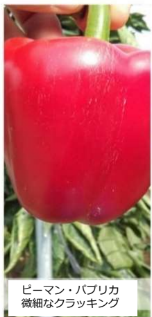
ピーマン・パプリカ 微細なクラッキング