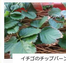
イチゴのチップバーン