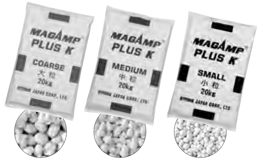
※粒写真はすべて実物大です。